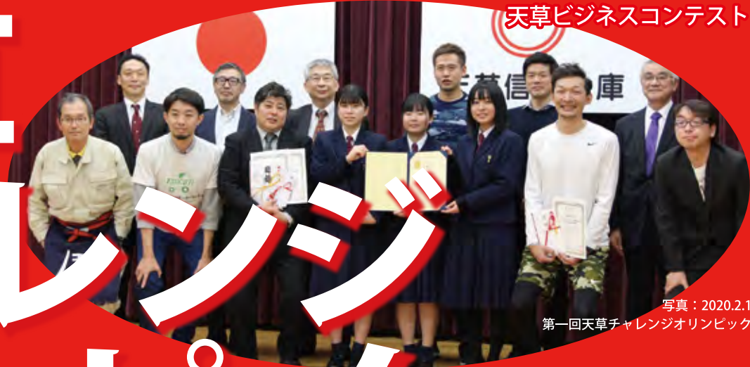
写真：2020.2.1 第一回天草チャレンジオリンピック

天草は天地人の恵み豊かな宝島。だからこそ失敗を恐れないチャレンジし放題な島だと言えるのではないのでしょうか。「天草バージョンアップサミット」「天草宝島起業塾」等を通して芽吹いた種を、花開かせる場として、昨年に引き続き、ビジネスコンテスト「天草チャレンジオリンピック」を開催します。天草の様々な可能性を活かすチャレンジのアイデアや実践を発表いただき、 ヒトモノカネ（投資家、担い手、技術、物件等）のご縁づくりにお役立てください！