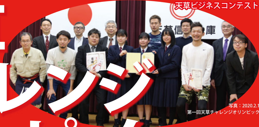
写真：2020.2.1 第一回天草チャレンジオリンピック

天草は天地人の恵み豊かな宝島。だからこそ失敗を恐れないチャレンジし放題な島だと言えるのではないのでしょうか。「天草バージョンアップサミット」「天草宝島起業塾」等を通して芽吹いた種を、花開かせる場として、昨年に引き続き、ビジネスコンテスト「天草チャレンジオリンピック」を開催します。天草の様々な可能性を活かすチャレンジのアイデアや実践を発表いただき、 ヒトモノカネ（投資家、担い手、技術、物件等）のご縁づくりにお役立てください！